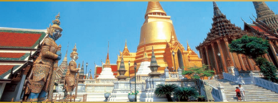
Temple d'Or de Bangkok