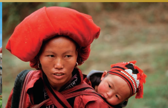
Vietnam du Nord