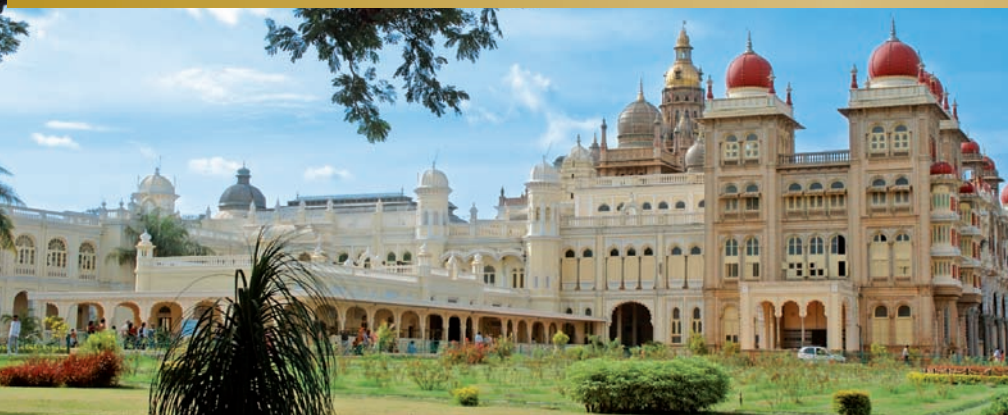
Mysore - Palais du Maharadjah