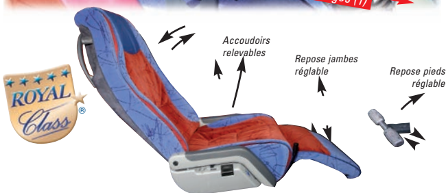
(1) de 0,95 m à 1,05 m suivant le type d'autocar, au lieu d'environ 0,75 m pour un car de grand tourisme classique