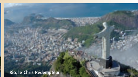
Rio, le Christ Rédempteur