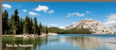
Parc de Yosemite

Partez de votre région : possibilité de départ de Province (nous consulter)