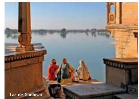
Lac de Gadhisar