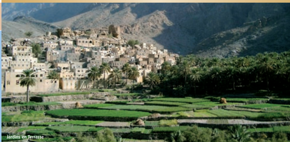
Jardins en Terrasse