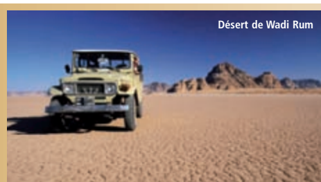
Désert de Wadi Rum