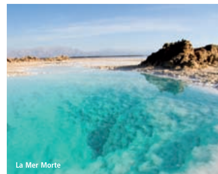
La Mer Morte