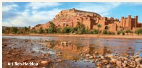
Ait Ben Haddou

Ces prix comprennent : • Le transport aérien sur vols réguliers Royal Air Maroc (en classe W) au départ de Paris • Les taxes aéroport : 135 € • L'accueil, les transferts et le transport en véhicule privatif avec chauffeur et guide francophone • Le logement en chambre double dans les hôtels mentionnés ou similaires • La demi pension • Les visites et excursions programmées, les droits d'entrées dans les sites • Les assurances : assistance et rapatriement. Ces prix ne comprennent pas : • Les déjeuners • Les boissons • Les pourboires • Les dépenses personnelles • L'assurance annulation • En hôtels standard : les services d'un guide francophone.