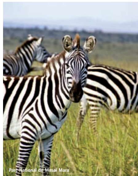
Parc National de Masai Mara