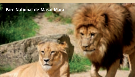
Parc National de Masai Mara