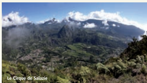
Le Cirque de Salazie

Formalités administratives : Passport en cours de validité