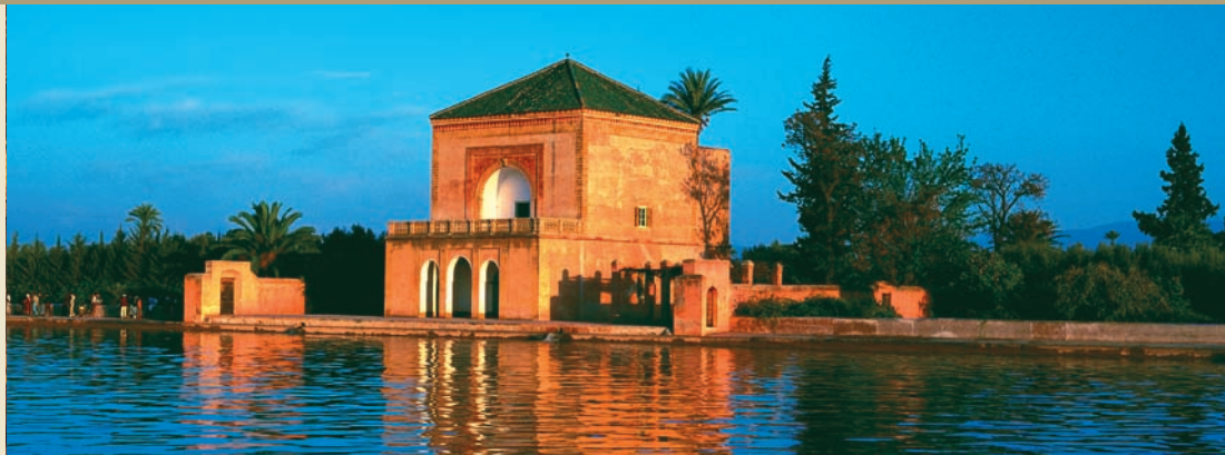
Marrakech - la Ménara