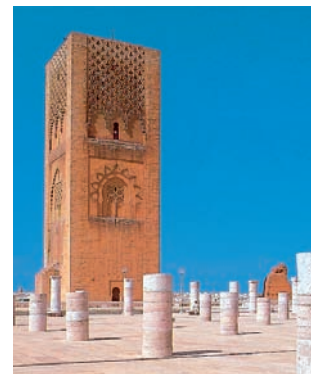
Rabat - Tour Hassan

J 8. Retour de Marrakech : temps libre en fonction des horaires de vol, transfert à l'aéroport de Marrakech. Assistance aux formalités d'enregistrement puis → pour Paris, ou Nantes sur vol spécial. Débarquement puis retour en autocar dans votre ville.