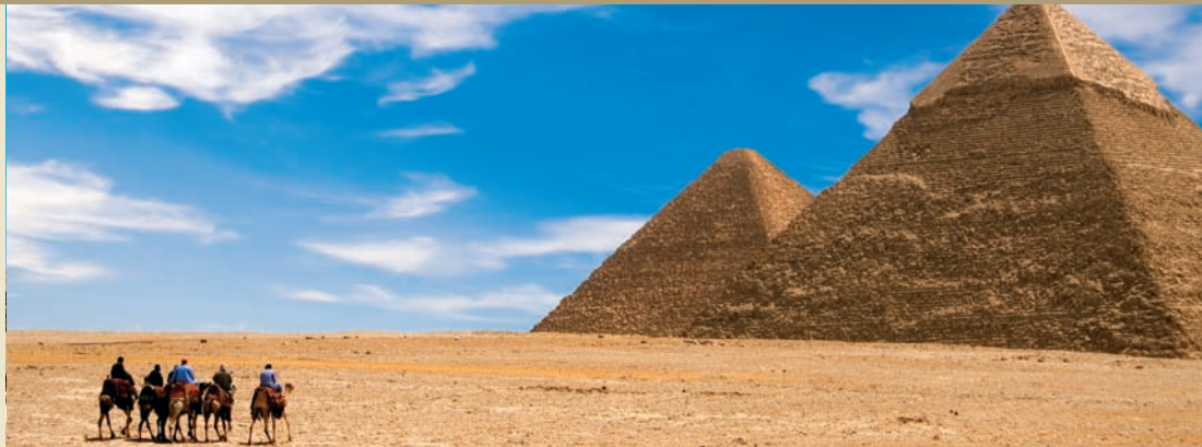
Pyramides de Guizeh