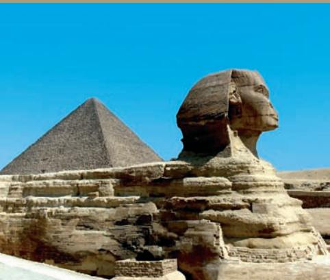
Le Caire, le Sphinx