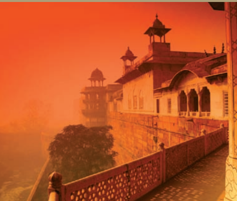
Fort Rouge d'Agra