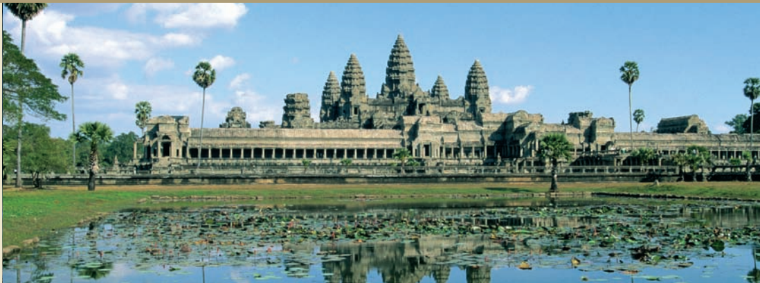
Cambodge - Angkor Vat