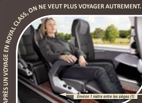
Environ 1 mètre entre les sièges (1)